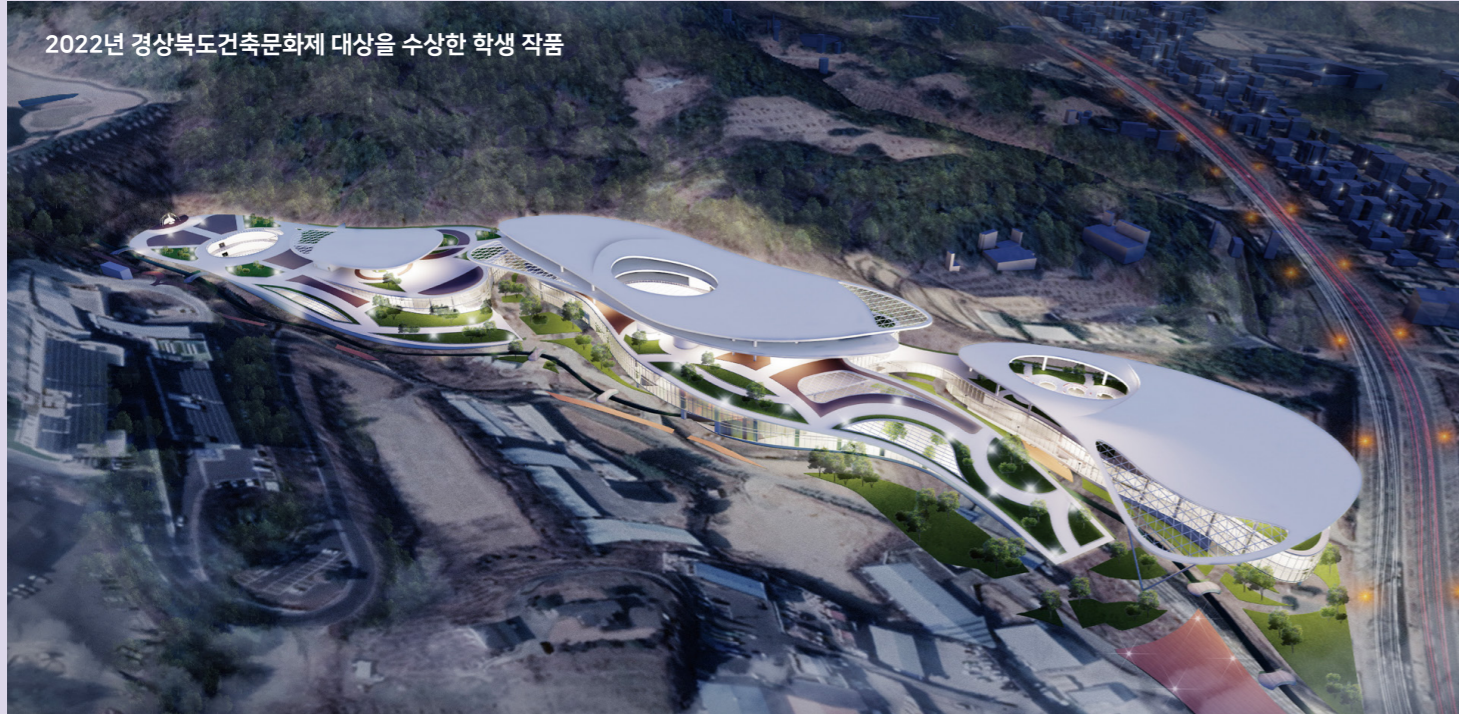
2022년 경상북도건축문화제 대상을 수상한 학생 작품