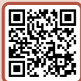
피아노과 홈페이지 바로가기