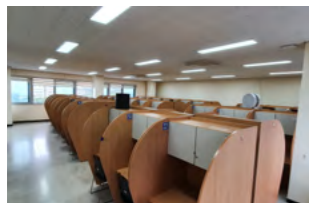
약학대학 국가고시 준비실