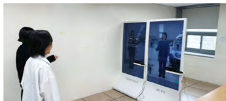
VR 의상 체험